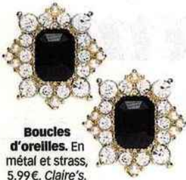
Boucles d'oreilles. En métal et strass, 5,99€, Claire's.