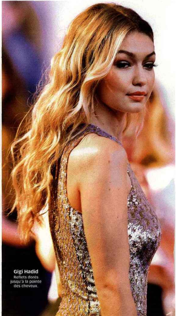
Gigi Hadid Reflets dorés jusqu'à la pointe des cheveux.