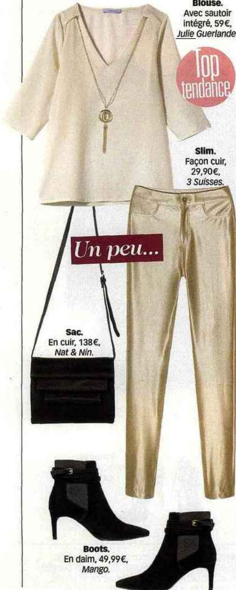
Blouse. Avec sautoir intégré, 59€, Julie Guerlande.

Par petites touches éparses ou en mode ultra glam, on se pare de reflets un peu, beaucoup, passionnément.